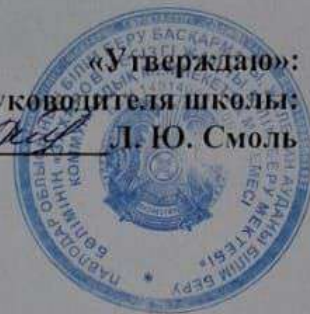
График проведения работы с родителями предшкольного класса на 2025-2026 учебный год